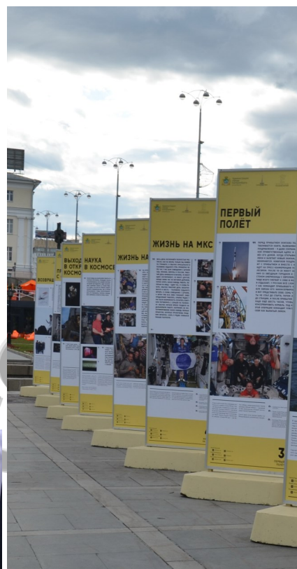
Стенды на выставке

Я даже примеряла уникальную перчатку, в которой С.В. Прокопьев работал в открытом космосе! Теперь она передана в дар Екатеринбургскому планетарию и станет экспонатом музея.