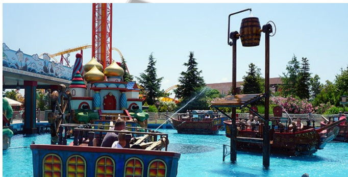
Те самые лодочки и бочка

Больше всего мне понравился Сочи Парк. Это огромный парк развлечений.