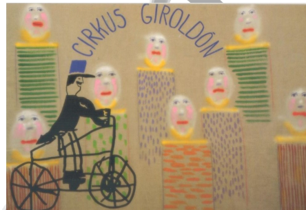
Афиша самого маленького (!) цирка в Европе «Circus Giroldon»

этом жёлтом шатре нет сцены и зрительного зала, здесь все участвуют в происходящем. Мне это очень понравилось.