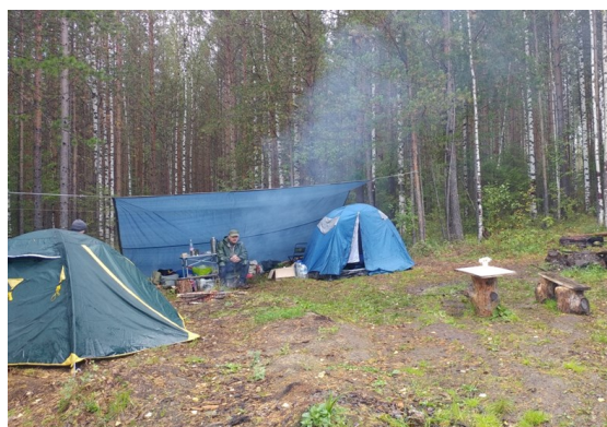
Лагерь в горах