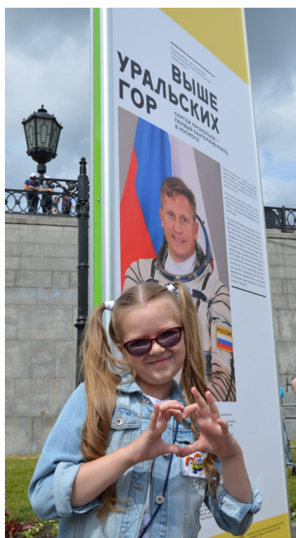
КосмоДаша на выставке

Московский Музей Космонавтики и Екатеринбургский планетарий организовали фотовыставку, посвященную первому полёту космонавта из Екатеринбурга – Сергея Валерьевича Прокопьева.