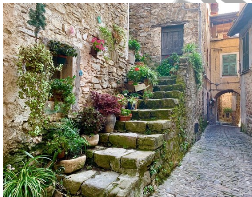
Живописные улочки Италии

Больше всего мне запомнились старые города, которые