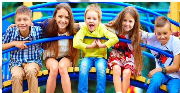
Так мы представляем себе каникулы

В каждой стране каникулы были приняты и восприняты по-своему. Везде границы летнего отдыха для ребят определены, исходя из природных особенностей региона. Так, каникулы в России из-за более или менее одинаковых погодных условий приходится на период с 1 июня по 31 августа. В Испании летние каникулы, как и во многих странах Европы, длятся всего два ме-