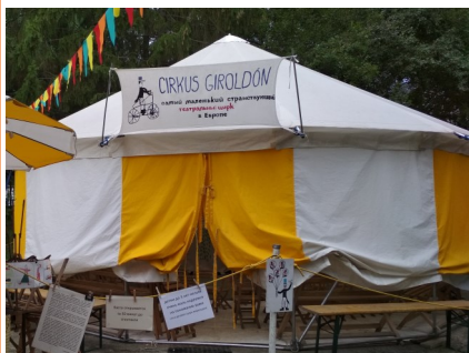
Тот самый волшебный шатёр

Летом 2019 года в Литературном квартале появился удивительный шатёр, а непо-