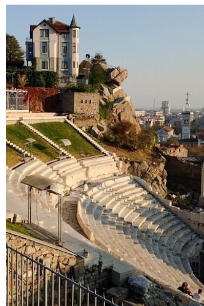
Улочки Болгарии Ноговицына Мария

зательно встретят на вокзале. Я очень жду нашу поездку в Казань.