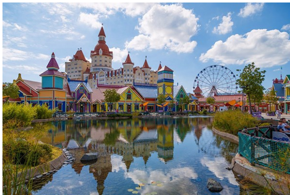
Вид на Сочи Парк

Мы остановились в отеле Гамма, который был совсем рядом с Сочи Парком. Каждый день мы