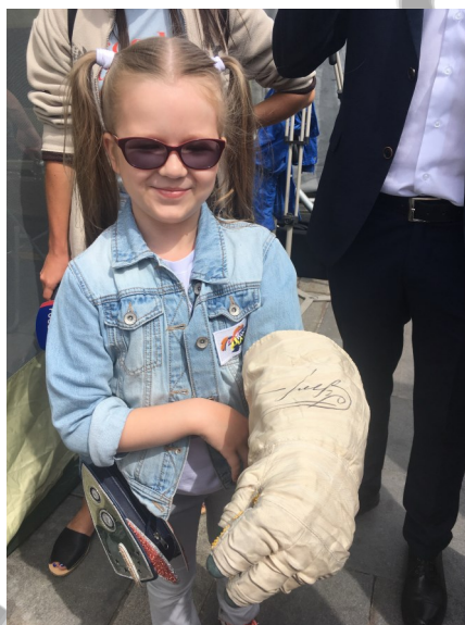
Та самая перчатка