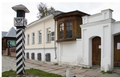
Дом-музей Ф.М. Решетникова

Самое интересное это кухня-столовая для ямщиков. Я узнала, что их любимым блюдом были щи: они съедали по 6 порций каждый и выпивали по 10 кружек чая. В столо-