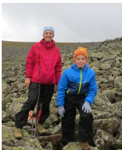
С мамой на курумниках

«Конжаковский камень – высочайшая точка Свердловской области и одна из самых высоких вершин Уральских гор. Находится Конжак недалеко от города Карпинска (500 км от Екатеринбурга).