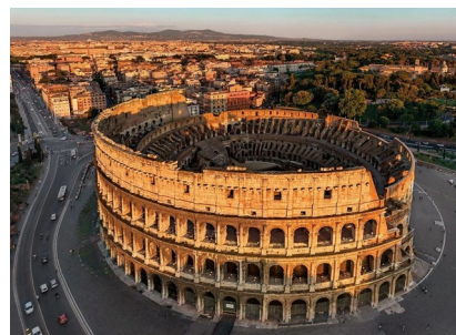
Коллизей – сердце Рима

жду с нетерпением новой встречи с этим прекрасным городом.