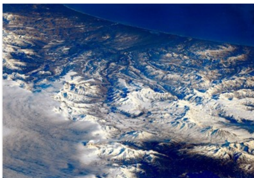
Камчатка, вид из космоса

С.П.: Таких мест достаточно много. Больше всего мне понравилась наша страна, где есть такие прекрасные места, как Алтай, Камчатка. Особенно мне понравились атоллы в Южном океане ( Атолл — коралловый остров, имеющий вид сплошного или разорванного кольца, окружающего лагуну ) Новая Зеландия – очень красивая сверху. А так же мне понравился остров Таити. Я думаю, что обязательно там побываю