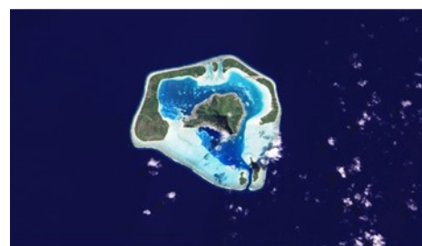
О. Таити, вид из космоса

Д: Известно, что на Международной Космической Станции (далее МКС) есть более 20 ноутбуков, но все они по виду – устаревшие. Качественно ли они работают? Планируют ли их менять?