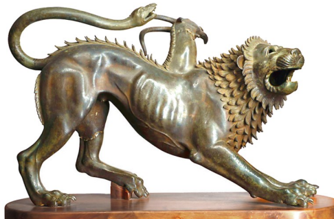
Химера из Амеццо

фресках зданий в Древней Греции их довольно часто изображали.