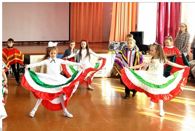
Ученики 1 «Е» в роли молодых мексиканцев

переливающиеся в разные темпы, красочные и солнечные костюмы, подчеркивающие жизнерадостность и любовь к жизни мексиканцев» – вот что понравилось ребятам! Во время репетиций они сразу же прониклись интересом к танцу и культуре этой далекой и яркой страны. Дружная подготовка, мастерство ребят, техническая точность, партнерская согласованность позволила создать потрясающий номер!