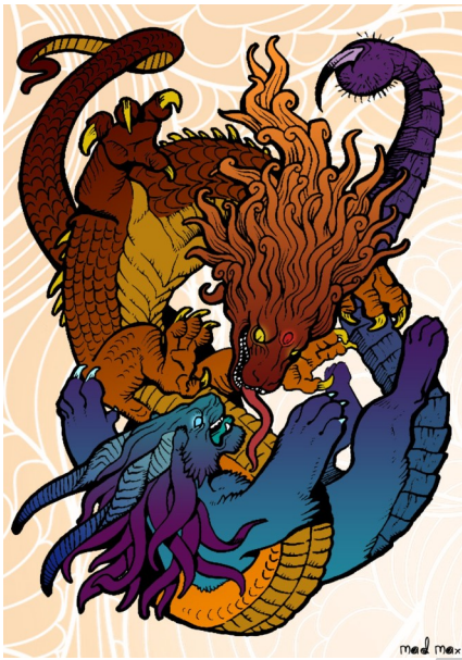
Тифон и Ехидна, «родители» Химеры

В рамках небольшой статьи невозможно рассказать обо всём великолепии древнегреческого искусства. Поэтому я познакомлю вас с традицией химеризации в искусстве.