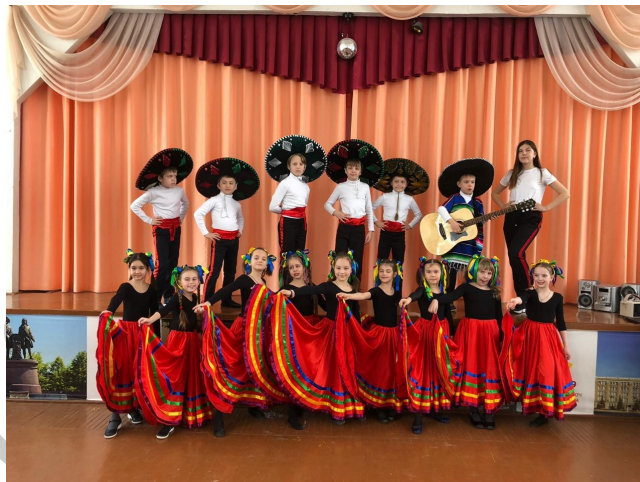
По-настоящему яркое выступление

ребят в незабываемое путешествие по всему миру! Они с не-